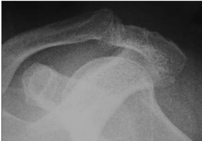
Resim 2. Sol omuz direkt grafi.

Sağ omuz manyetik rezonans görüntüleme (MRG) akromioklavikuler eklemlerde hipertrofik dejeneratif değişiklikler, eklemler içinde, subakromial bursada ve bisipital tendon çevresinde sıvı artışı, supraspinatus tendonunda total yırtık, diğer rotator kaf tendonlarında heterojen sinyal intensiteleri tespit edildi (Resim 3). Sol omuz MRG'de; akromioklavikuler eklemlerde hipertrofik dejeneratif değişiklikler, subakromial bursa, subdeltoid bursa, komşu yumuşak dokularda, bisipital tendon çevresinde ve eklemler içinde sıvı artışı, supraspinatus tendonunda total yırtık, infraspinatus tendonunda incelleme ve sinyal artışı (parsiyel rüptür) tespit edildi (Resim 4).