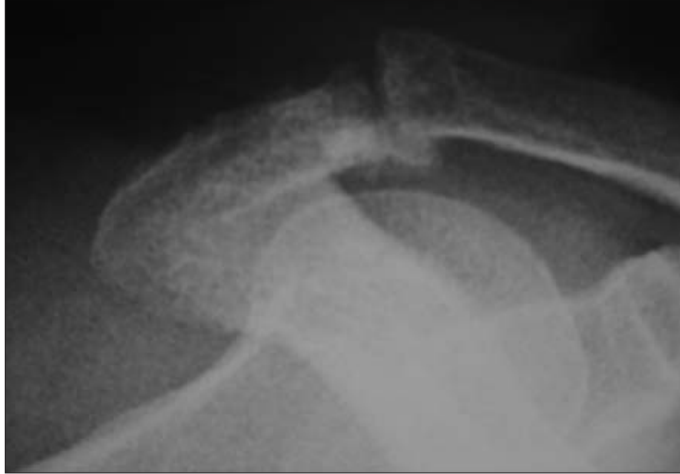
Resim 1. Sağ omuz direkt grafi.

Laboratuvar bulgularında eritrosit sedimentasyon hızı, C-reaktif protein (CRP), hemogram ve diğer biyokimyasal parametreler normal sınırlarda idi. Açlık kan şekeri 114mg/dl iken HbA1C normaldi. Her iki omuz ön-arka, skapula Y ve aksiller grafileri çekildi. İki omuzda da özellikle akromioklavikuler eklemlerde, akromion ve klavikulanın alt ucunda büyük osteofitik formasyonlarla belirginleşen ileri derecede dejeneratif değişiklikler ve eklemler aralığında daralma tespit edildi (Resim 1,2).