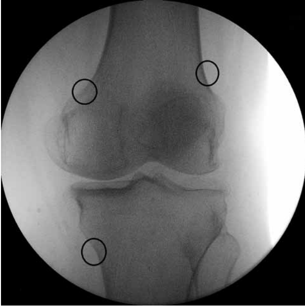
Şekil 2. Ön arka diz skopi görüntüsünde geniküler sinirlerin olası yerleri görülmekte.

ve yan skopi görüntüleri ile 10 cm, 22-gauge, 10 mm aktif uçlu RFT kanülü (NeuroTherm™, Medipoint GmbH, Hamburg, Germany) yerleştirildi (Şekil 3, 4). Ön-arka ve yan skopi ile RFT kanülü ucunun yeri görüntülendi. Daha sonra 50 Hz ile duyuşsal uyarı, 2 volt ile motor uyarı araştırıldı. Duyuşsal uyarı için