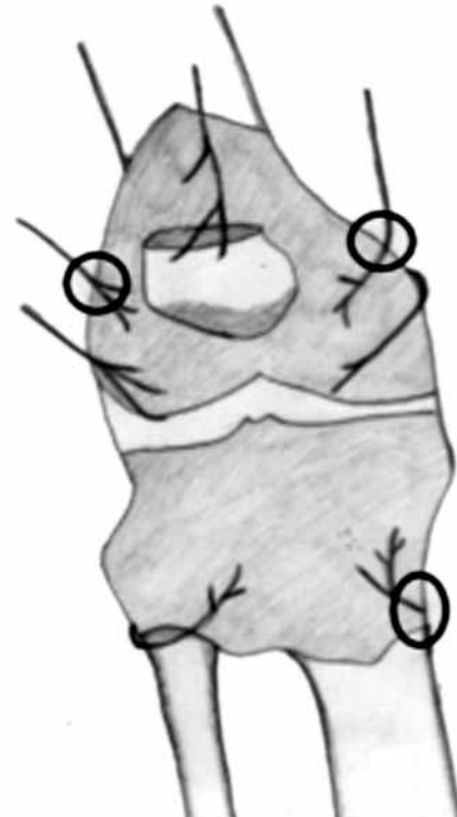
Şekil 1. Femur alt ucunda medial ve lateral bölgede ve tibia medialinde geniküler sinirlerin olası yerleri orijinal çizimle gösterilmiştir.

Hastalar sırtüstü pozisyonda yatırıldı, popliteal fossa altına ufak bir yastık konularak diz desteklendi. Floroskopi ile tibiofemoral eklem görüntüldü. Femur alt ucunda medial ve lateral bölgede ve tibia medialinde geniküler sinirlerin olası yerleri (Şekil 1, 2) skopi ile tespit edildi. Femur alt ve tibia üst bölgesi sterilize edildi. Cilt ve cilt altına %2 lidokain uygulanarak anestezi sağlandı. Her bir geniküler sinir için ön-arka