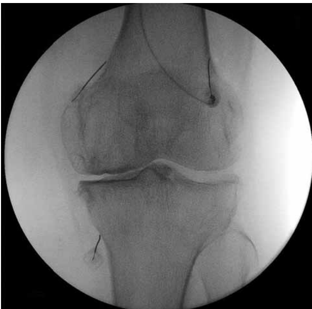
Şekil 3. Çalışmaya dahil edilen hastalardan birinin radyofrekans termokoagülasyon işleminin floroskopik ön arka görüntülenmesi.

ve yan skopi görüntüleri ile 10 cm, 22-gauge, 10 mm aktif uçlu RFT kanülü (NeuroTherm™, Medipoint GmbH, Hamburg, Germany) yerleştirildi (Şekil 3, 4). Ön-arka ve yan skopi ile RFT kanülü ucunun yeri görüntülendi. Daha sonra 50 Hz ile duyuşsal uyarı, 2 volt ile motor uyarı araştırıldı. Duyuşsal uyarı için