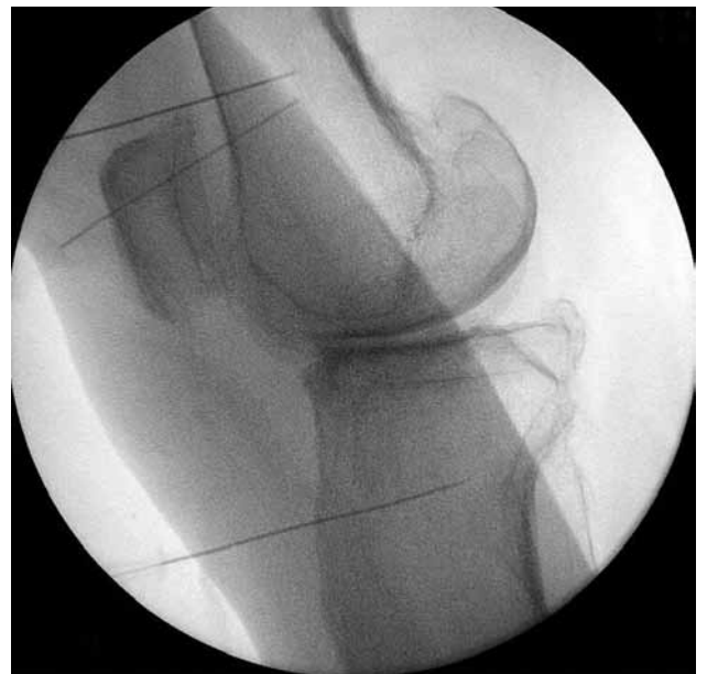
Şekil 4. Çalışmaya dahil edilen hastalardan birinin radyofrekans termokoagülasyon işleminin floroskopik yan görüntülenmesi.

Bu deęerlendirme yöntemleri, başlangıçta, ameliyat sonrası birinci ve üçüncü ayda kullanıldı. Geniküler sinir RF işlemi sonrası oluşan komplikasyon ve yan etkiler (enfeksiyon, kanama, nörolojik hasar vb.) kaydedildi.